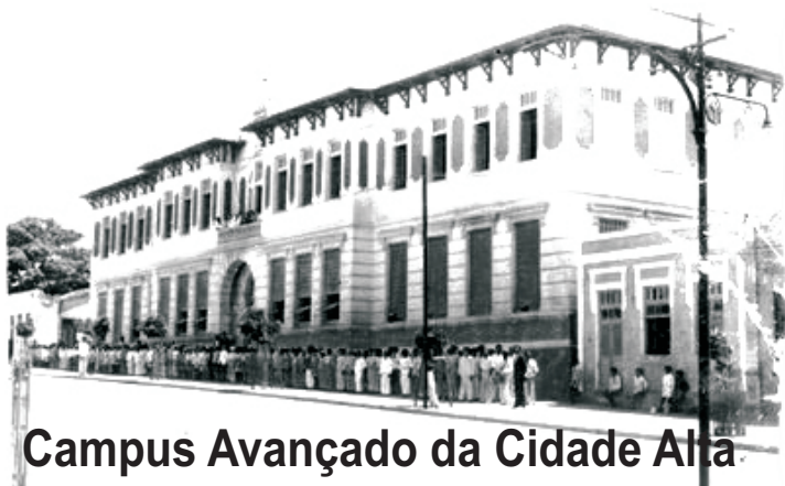
Campus Avançado da Cidade Alta